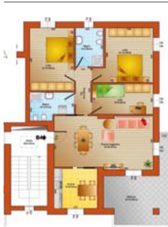
B4 | piano 2°