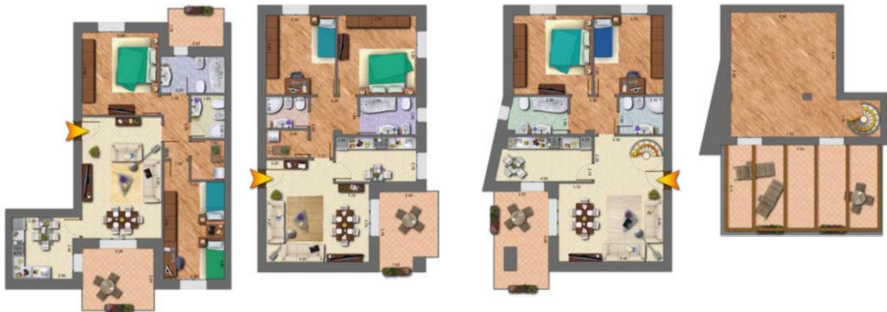
Piano quarto e sottotetto

PROGETTISTA: ARCH. GABRIELE LOTTICI (CONSULENTE CASA CLIMA®)