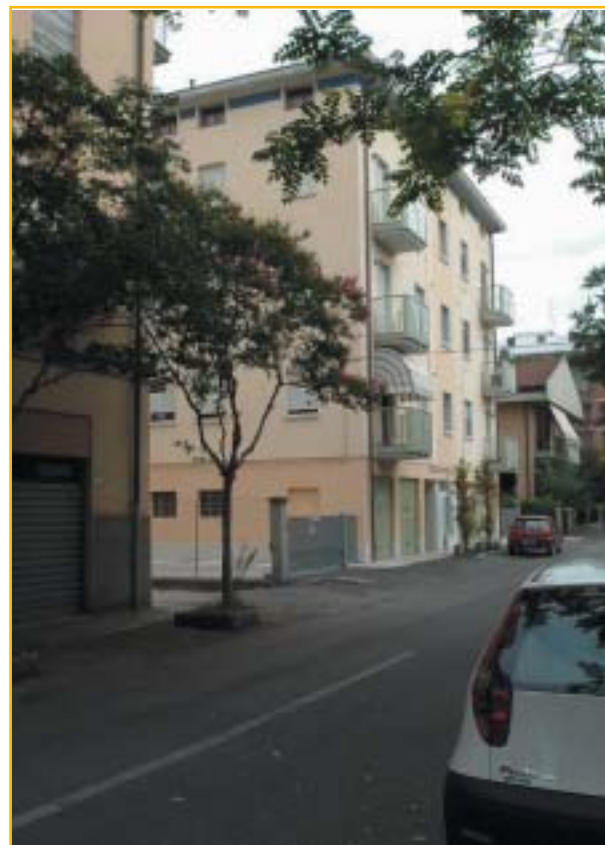
fronte via Boccherini