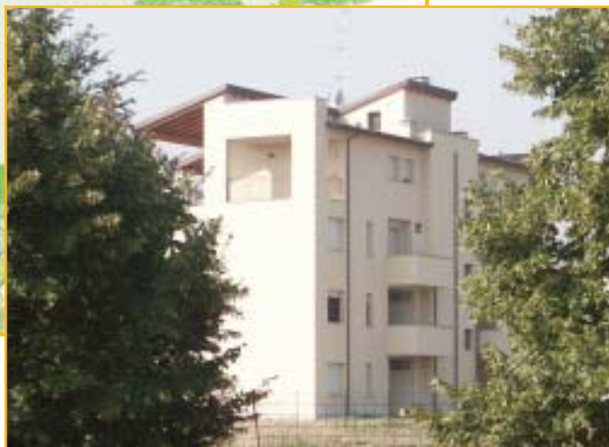
vista dal parco