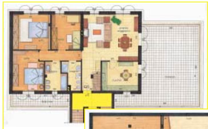
piano secondo attico con sottotetto