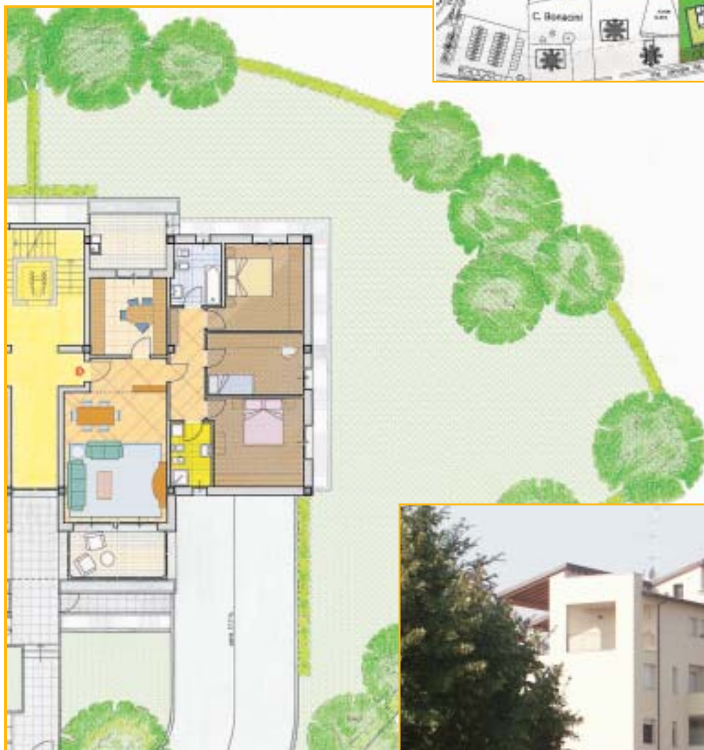
pianta piano terra