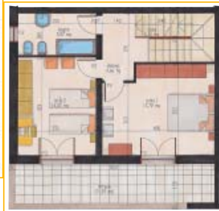
piano primo e secondo