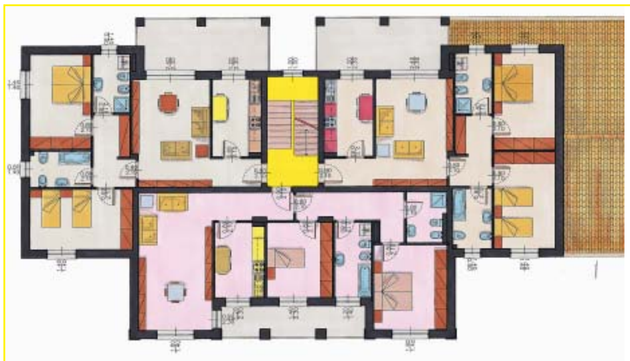
piano primo e secondo