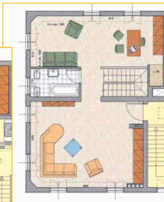
tipologia appartamento duplex al piano 3°- 4°