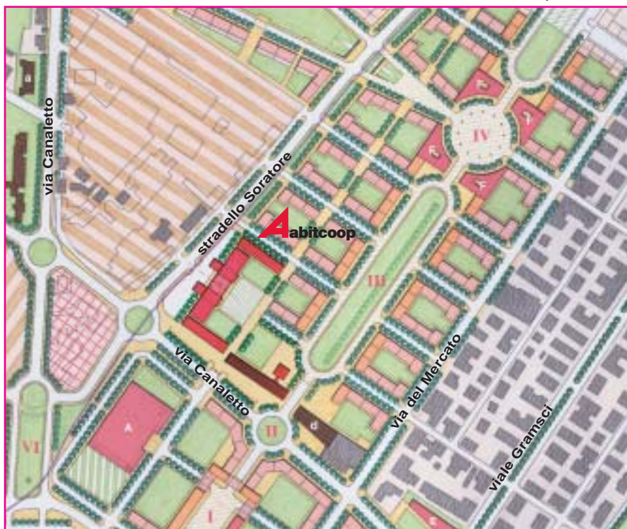
prospettiva del comparto Abitcoop