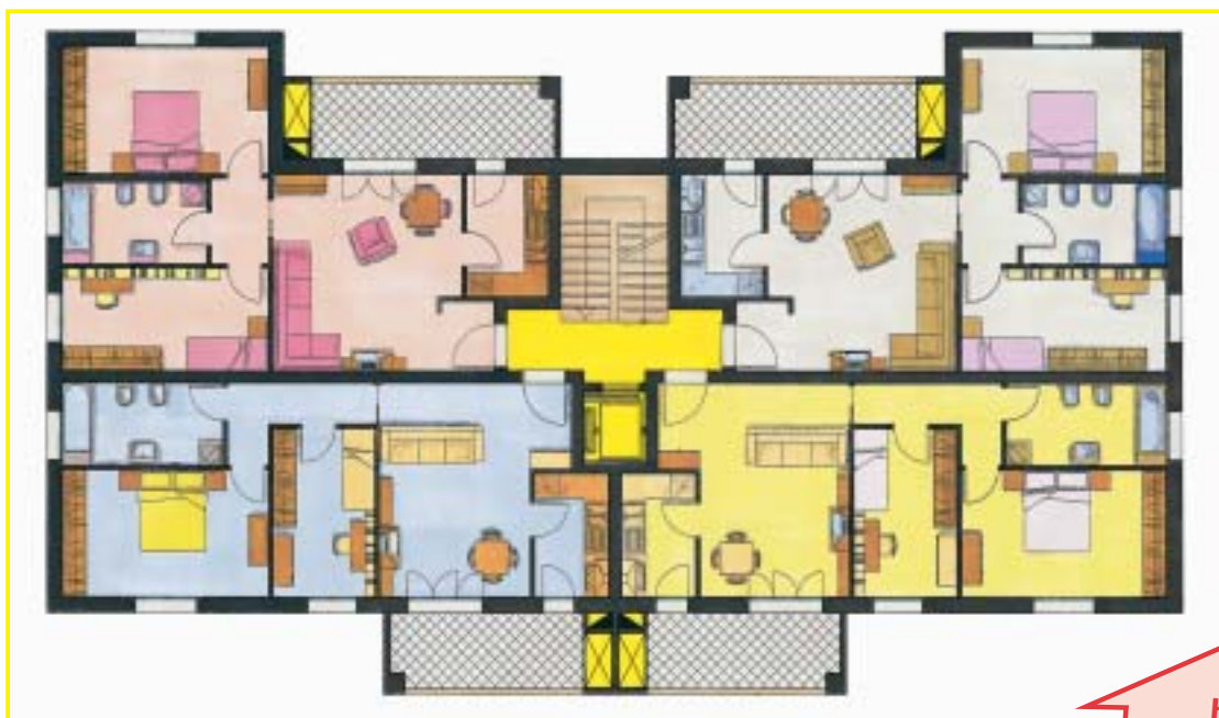
pianta piano tipo